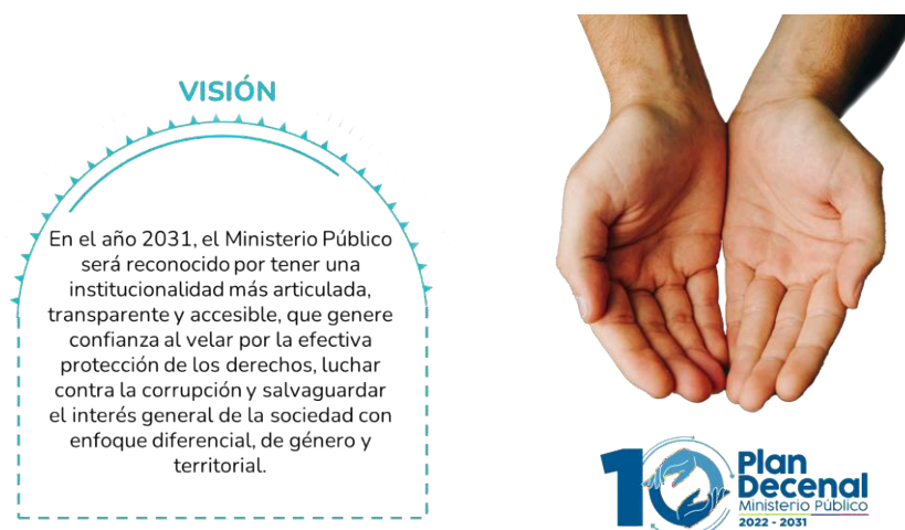
Gráfico 5: Visión del Ministerio en el año 2031 6 .

Todas estas observaciones generan como resultado el siguiente postulado que corresponde a la visión del Ministerio Público a 2031: