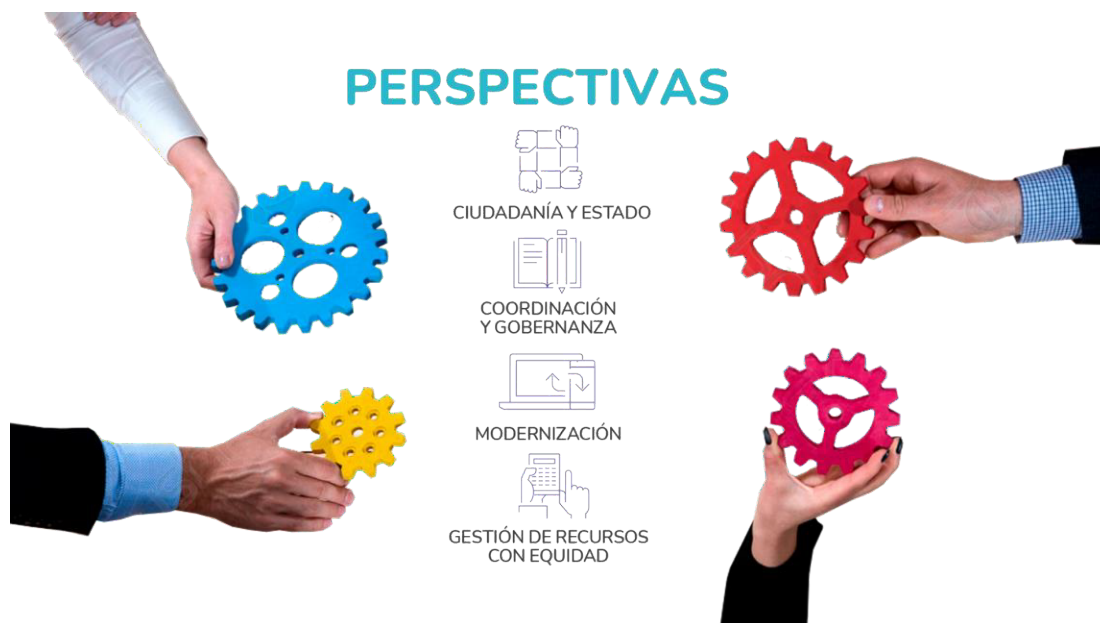
Gráfico 3: Perspectivas del PDMP 3

comprensión integral del PDMP y estructuran el cumplimiento de los objetivos que perseguirá a largo plazo, facilitando la identificación de relaciones relevantes y puntos de encuentro. Así, la construcción de los elementos de direccionamiento estratégico se complementa desde la mayor generalidad hasta la identificación específica de qué acciones son necesarias emprender y quiénes son los actores responsables de su ejecución; en otras palabras, ayuda a determinar las acciones de mejora y logra efectivamente la articulación de acciones para la obtención de los resultados deseados.