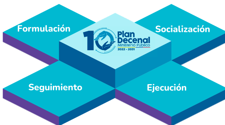
Gráfico1: Etapas del PDMP 1 .

Uno de los grandes retos planteados al Ministerio Público en cabeza de la Procuradora General de la Nación ha sido la formulación e implementación del Plan Decenal del Ministerio Público (PDMP) para el periodo 2022 – 2031. La articulación del PDMP representa tanto un desafío interinstitucional como una excepcional oportunidad de transformación y tiene como propósito servir de hoja de ruta para que las entidades que conforman el Ministerio Público (PGN, Defensoría del Pueblo y personerías distritales y municipales) puedan generar una institucionalidad más articulada, transparente y accesible en la oferta de sus servicios a la ciudadanía; una institucionalidad que genere confianza y vele por la efectiva protección de los derechos, la lucha contra la corrupción y la salvaguarda del interés general de la sociedad con enfoque diferencial, de género y territorial. Lo anterior, a través del desarrollo de actividades y proyectos armonizados desde los despliegues misionales de cada entidad, dando cumplimiento a sus deberes constitucionales a partir de la aplicación de los principios de coordinación, eficiencia y modernización.