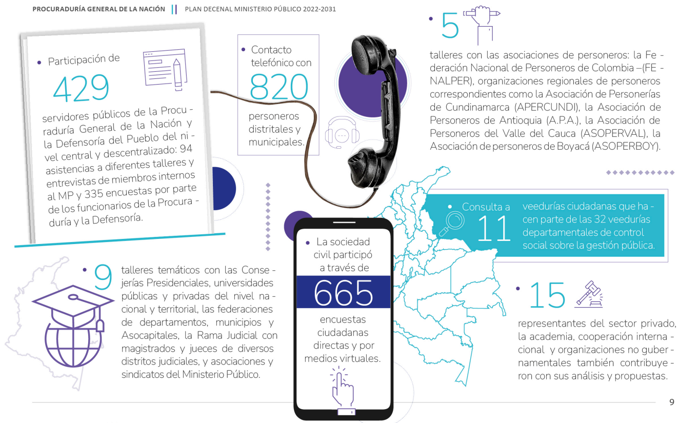
Gráfico 2: Proceso de Construcción Participativo PDMP 2 .

PROCURADURÍA GENERAL DE LA NACIÓN || PLAN DECENAL MINISTERIO PÚBLICO 2022-2031