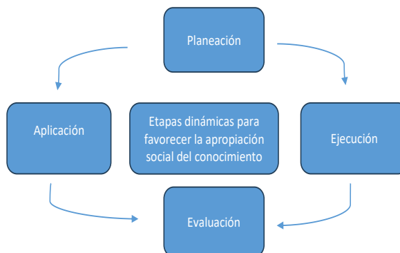
Ilustración No. 3. Ciclo de la investigación IEMP

Es así como el IEMP ha avanzado hacia un nuevo diseño sobre la base de lo construido, llegando al actual ciclo de la investigación que se consolida con las etapas del proceso definidas en el reglamento académico, como se muestra en la siguiente ilustración: