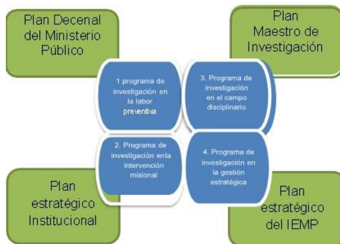
Ilustración No. 1. Estructura de la gestión investigativa en el IEMP

En el nivel metodológico, la operacionalización alcanza la dimensión comprensiva, prospectiva y estratégica, a través del relacionamiento entre los programas, las líneas y los temas de investigación que se articulan con el Plan Decenal del Ministerio Público, el Plan Maestro de Investigación y los planes estratégicos institucionales, sin ser rígidos, pues buscan comprender los hechos cotidianos que son cambiantes, en armonía con las dinámicas organizacionales, institucionales, sociales y globales. Esta articulación se refleja en la siguiente ilustración tomada del Plan Maestro de Investigación (IEMP, 2023: p.27):