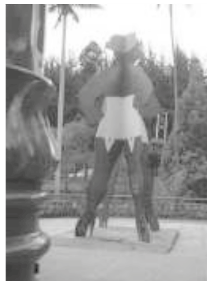
Figura 1. Rita 5:30 pm. Autor: Enrique Grau. Fecha de elaboración: 2000. Custodio: administración Parque Nacional Dirección: carrera 7a. Av. 39 Parque Nacional alameda peatonal.

La primera de las cinco obras que configuran los cinco gigantes es Rita 5:30 p.m. , esta obra de Enrique Grau es considerada como un monumento a la regeneración étnico-urbana , ubicada en la Alameda del Parque Nacional, se trata de un personaje femenino, una prostituta que se prepara desde las 5:30 para su trabajo. Este personaje recurrente en la obra de Grau, fue ubicado en forma de escultura (Grau tiene pinturas y esculturas en diversos materiales que la representan) en el año 2000, precisamente como un homenaje a su autor. Se puede decir, un poco en sentido literario, que la Rita es en sí un habitante urbano, una prostituta ya mayor y vestida de corsé, no lejana a los imaginarios de la ciudad.