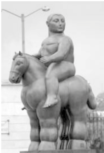
Figura 5. Hombre a Caballo. Autor. Fernando Botero. Técnica: modelado en bronce. Instalación: 1998. Ubicación: Parque el Renacimiento.

Ubicado en el parque del Renacimiento, en la calle 26 con carrera 22, el hombre a caballo de Fernando Botero es la última de las obras que se presentan en este texto. Hace parte también de un proyecto de recuperación de la ciudad, en este caso muy cerca del cementerio central.