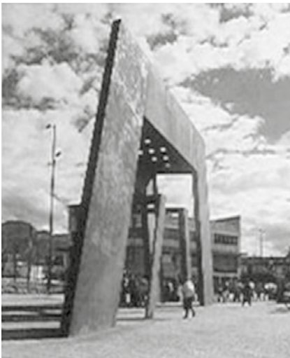
Figura 2. El pórtico. Autor: Eduardo Ramírez Villamizar. Fecha de inauguración: 19 de diciembre de 2000. Ubicación: Parque Tercer Milenio. Material: metal oxidado.