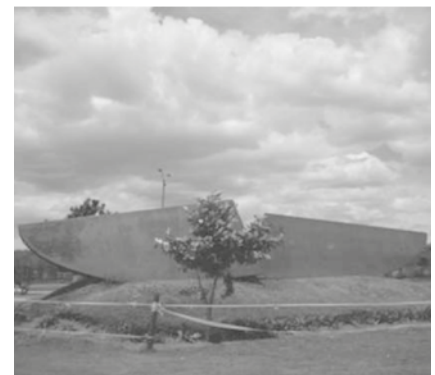
Figura 4. Título: Las Patillas de La Cordialidad. Artista: Ana Mercedes Hoyos. Material: lámina de acero. Longitud de 14 metros. Ubicación: Parque metropolitano el Tunal. Fecha de instalación: 20 de diciembre de 2000

Así pues, parece que no solo se trata de un proyecto de arte público, si se está de acuerdo con la autora, sino un elemento que tiene como fin refrescar el panorama de un sector particular mediante la cordialidad de la obra.