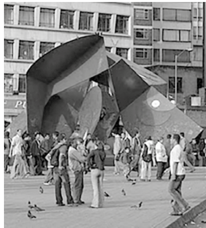
Figura 3. Título: Mariposa. Autor: Edgar Negret. Técnica y/o materiales: láminas metálicas policromadas y atornilladas. Ubicación: Plaza de San Victorino.

Esta obra, al menos en opinión del autor de este ensayo, representa el paradigma del arte público en una ciudad como Bogotá. Para una población que desconoce o no le interesa el significado artístico, la escultura no representa mayor cosa, más allá de un punto de encuentro, un lugar para descansar, tomarse una foto, resguardarse de la lluvia o usarla ocasionalmente como baño público. No obstante, el valor que posee es significativo, en la medida en que fue puesta allí, en el parque de San Victorino, para recuperar el espacio público, en una zona muy concurrida y difícil de la ciudad, en virtud de los altos índices de delincuencia común.